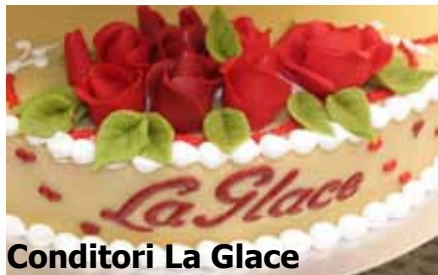
Conditori La Glace